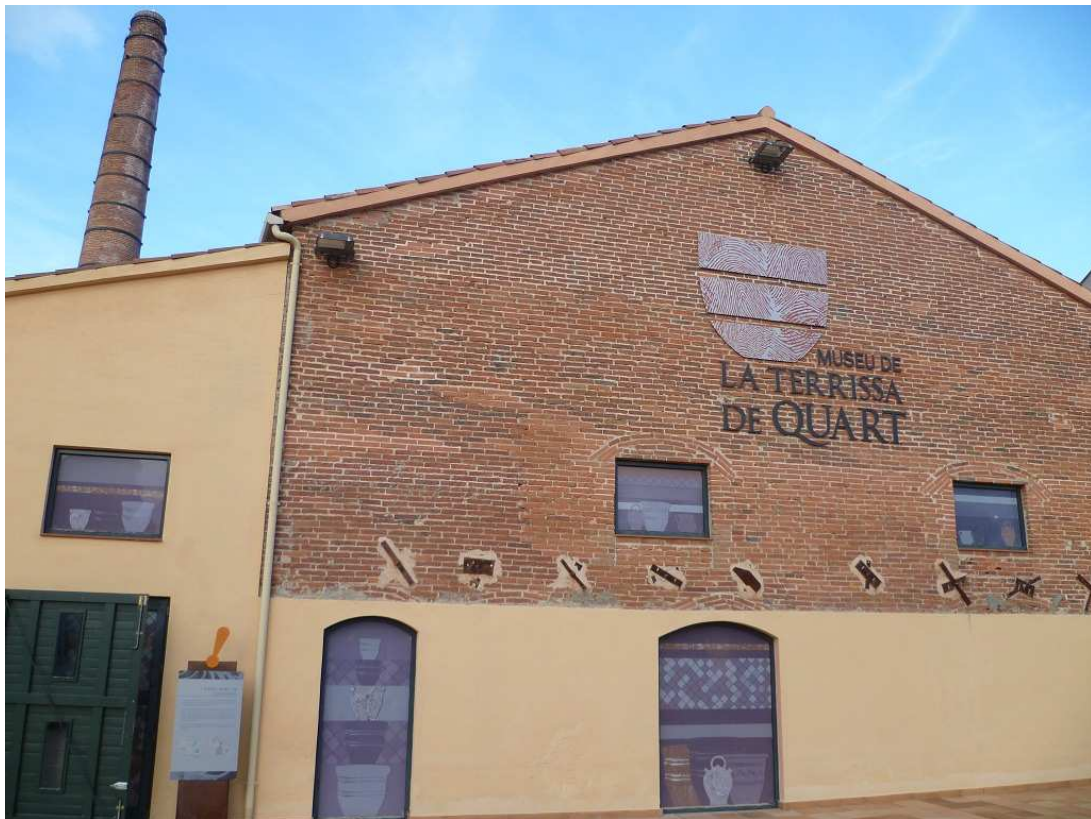
Il·lustració 3. Fachada principal del Museu de la Terrissa de Quart.