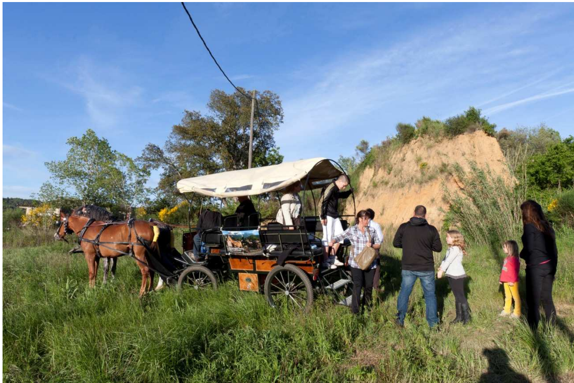
Ilustración 6. Visita a una cantera.

El Museu de la Terrissa de Quart sigue su extensión en el exterior del edificio con una serie de visitas para conocer los bosques de las Gavarres , de donde se obtenía la leña para quemar en los hornos; las canteras de donde se extraía la tierra para hacer el barro, las casas que habían tenido horno y actividad de alfarería, y los actuales obradores centenarios de los alfareros artesanos de la población.