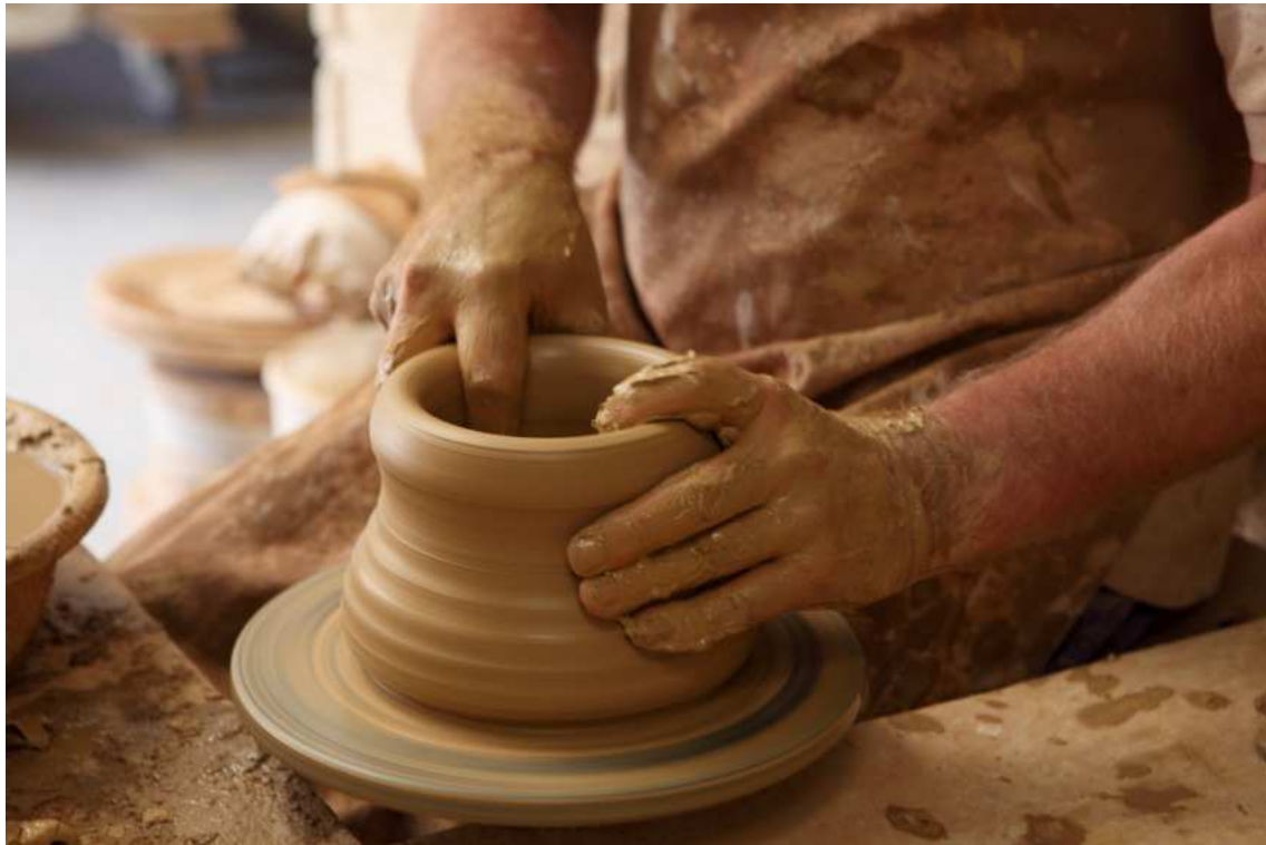
Ilustración 4. Artesano alfarero.