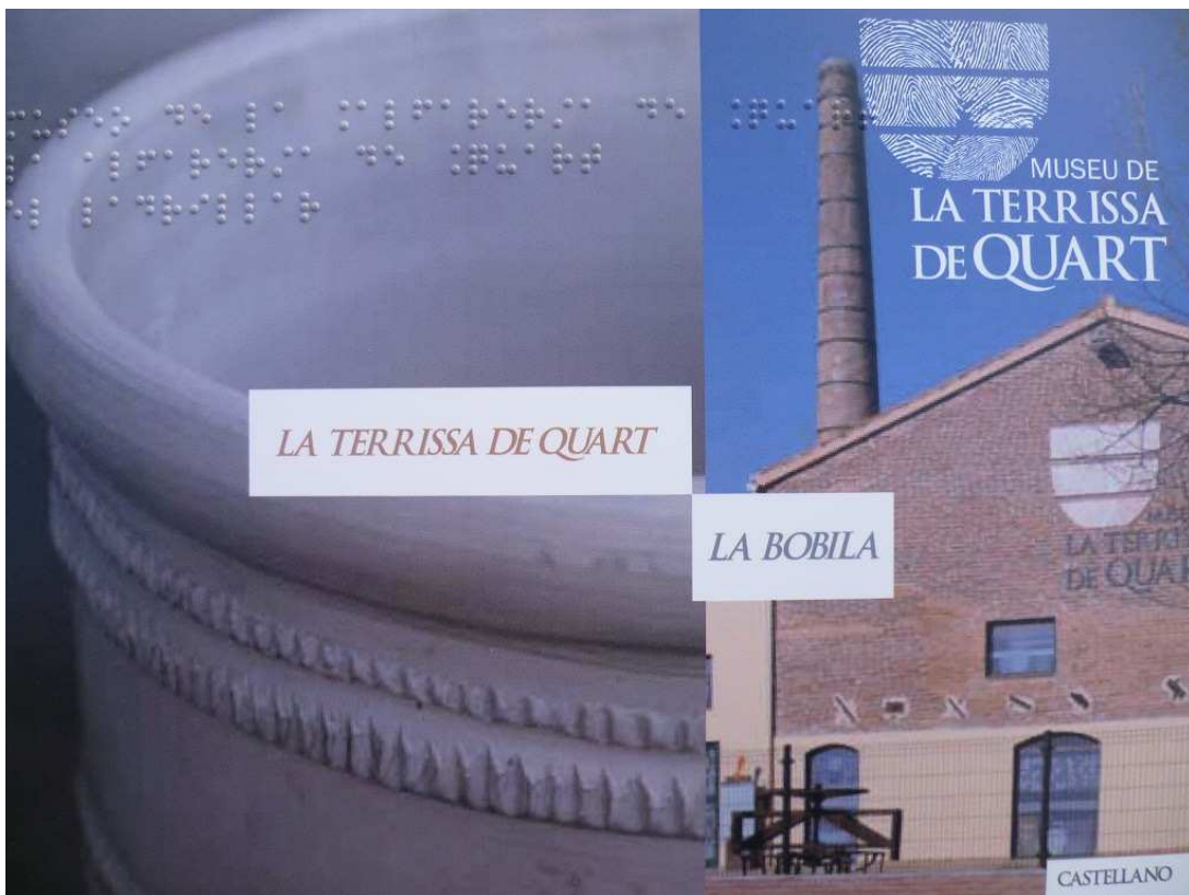
Ilustración 5. Guía del museo en braille.